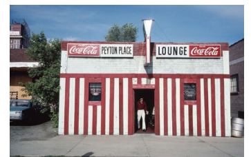
Joel Meyerowitz, Salt Lake City, 1976

WERTZUWACHS EUR 15.000 Ø PRO JAHR + 16,66 %