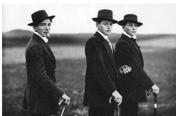
August Sander, Drei junge Bauern, 1914

Preis 2006 EUR 3.600 Preis 2023 EUR 11.000