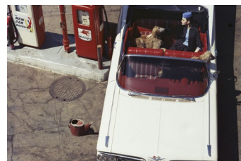
William Klein, Impala & Gas, NYC 1959

WERTZUWACHS EUR 14.850 Ø PRO JAHR + 43,11 %