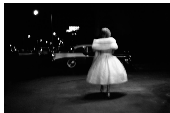
Vivian Maier, January 9, Florida, 1957

WERTZUWACHS EUR 7.400 Ø PRO JAHR + 11,42 %