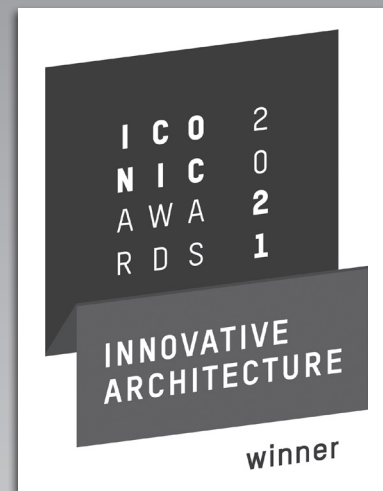
Iconic Awards 2021 – BUC-36®, Rangsdorf in der Kategorie Innovative Architecture – Stadtplanung