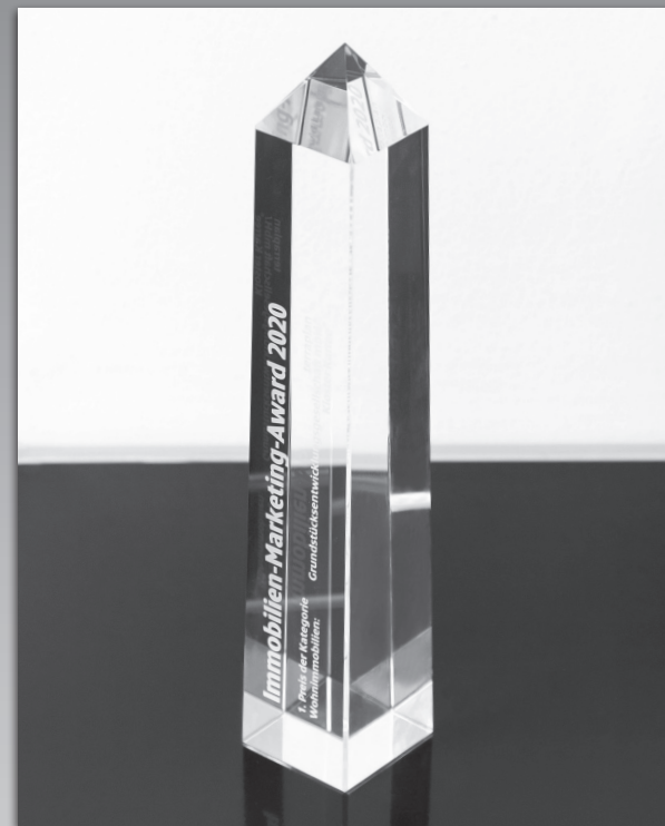
Immobilien-Marketing-Award 2020 Kloster Karree®, Bamberg in der Kategorie Wohnimmobilien