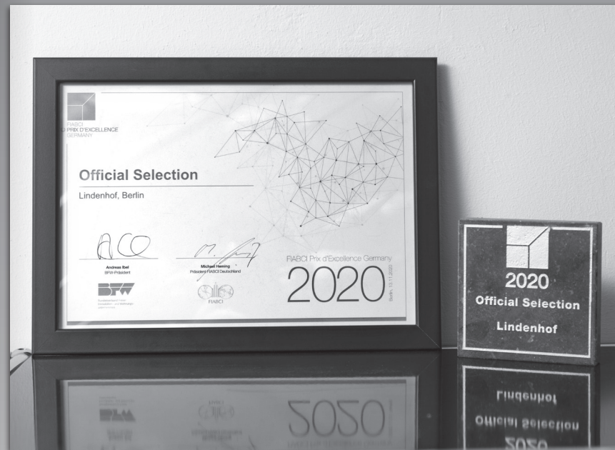
FIABCI Prix d'Excellence – Official Selection Lindenhof®, Berlin in der Kategorie Wohnen