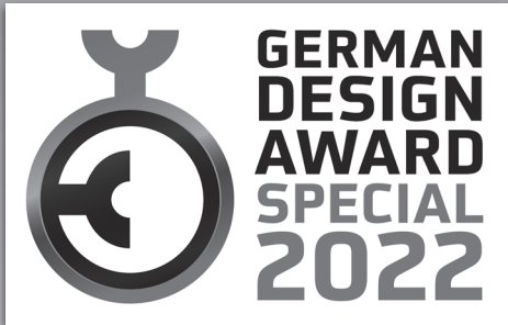
German Design Award 2022 Kloster Karree®, Bamberg in der Kategorie Excellent Communications Design – Corporate Identity